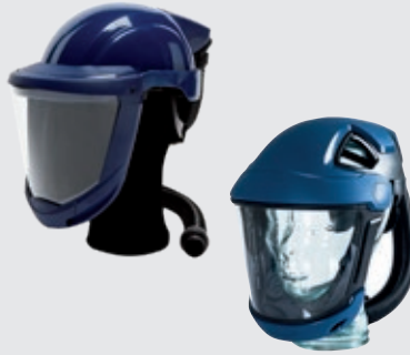
Casque SR 580 avec visière ou écran facial SR 570, avec ou sans casque de protection en fonction de la tâche.