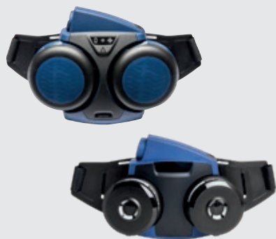
Vifteenhet SR 700 eller SR

Ved tungt arbeid og sterk støvkonsentrasjon og for brukere som er glattbarberte eller har ansiktshår, skjegg eller kinnskjegg.