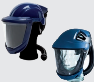
SR 580-hjelm med visir eller SR 570-ansiktsskjerm med eller uten støthette avhengig av arbeidssituasjonen.