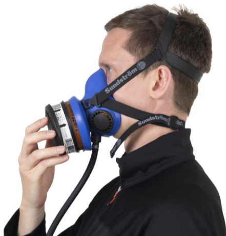
5.1 Filter mit Verschlussdeckel abdichten.

Sollten Sie eine Undichtigkeit entdecken, prüfen Sie die Ein- und Ausatemventile, stellen Sie die Bänder des Kopfgestells nach oder verwenden Sie das Atemschutzgerät in einer anderen Größe. Prüfen Sie den Sitz so lange, bis die Maske dicht ist.