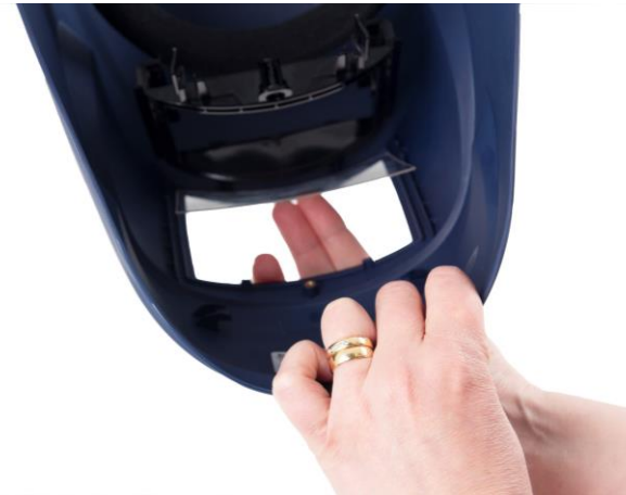
8.3 Lossa och ta bort det yttre skyddsglaset.