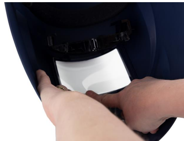
8.4 Montera det nya yttre skyddsglaset. Montera hållaren. Fäst skruven.