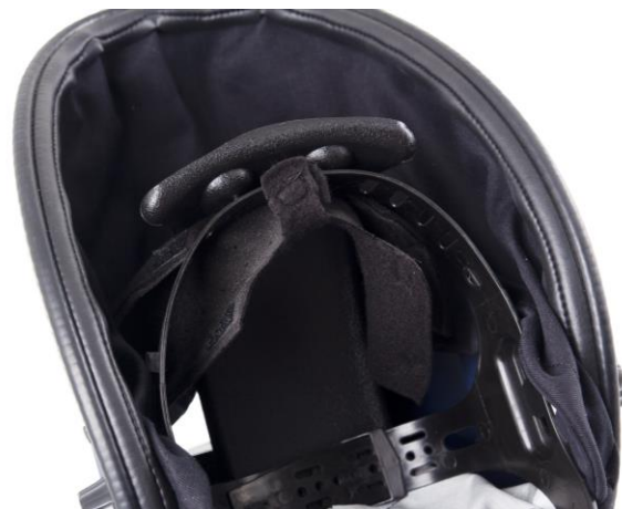
9.2 Montera svettbandet på huvudställningen