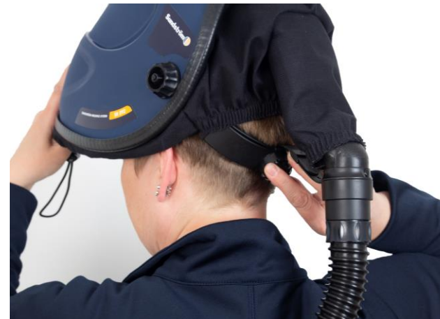
5.4 Justering av vidden på huvudställningen. Inställning av vidden på huvudställningen.