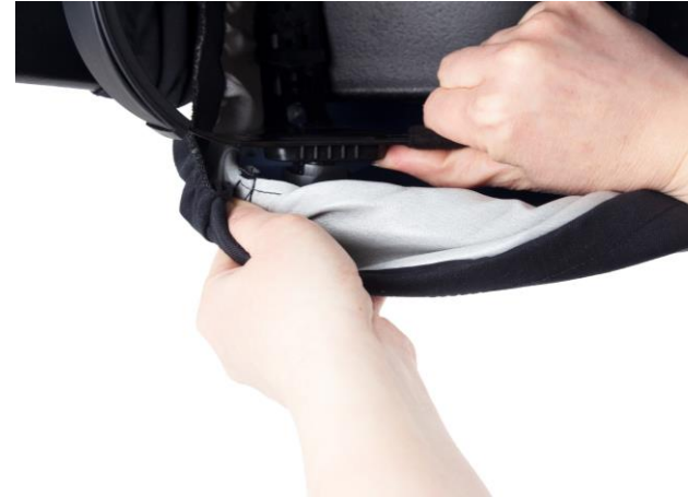
5.3 Justering av avstånd mellan skärm och huvudställning. Avståndet till skärmen. Lossa ratten tills ställningen går att flytta.