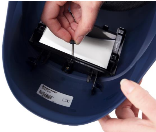
8.1 Lossa skruven i hållaren som håller svetsglaset