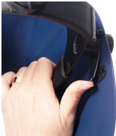
5.2 Justering av vinkeln mellan skärm och huvudställning. Vinkeln mot skärmen.