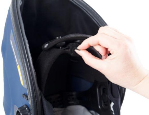
9.1 Ta bort svettbandet