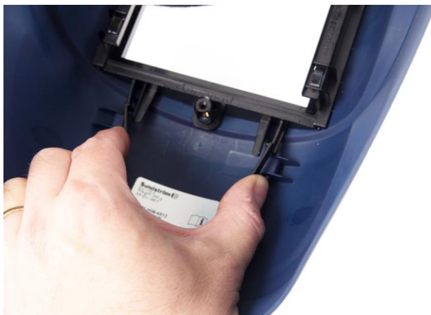
8.2 Lossa hållaren som håller svetsglaset.