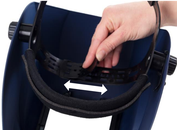
5.1 Justering i höjded. Hur högt skärmen sitter på huvudet.