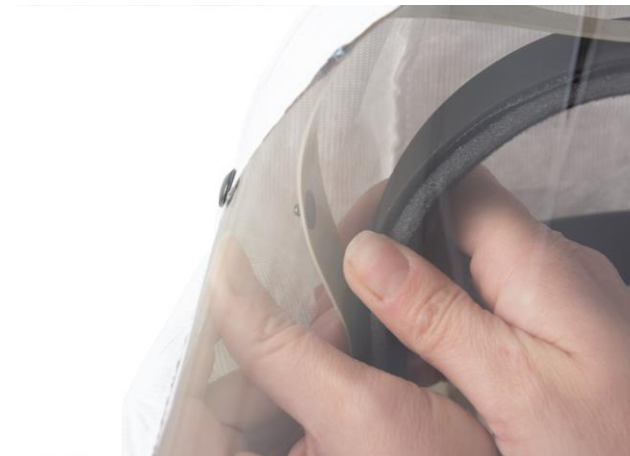
5.4 Lossa de tre tryckknapparna i siktskivans överkant. Lyft ut huvudställningen ur huvan..