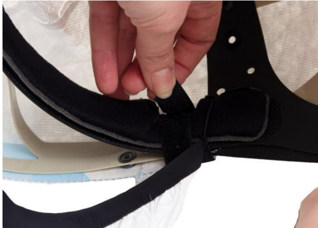
4.1 Lossa kardborrebanden.