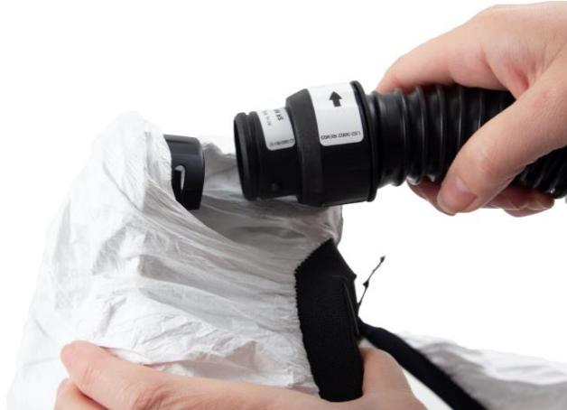
5.1 Lossa slangen ifrån adaptern.