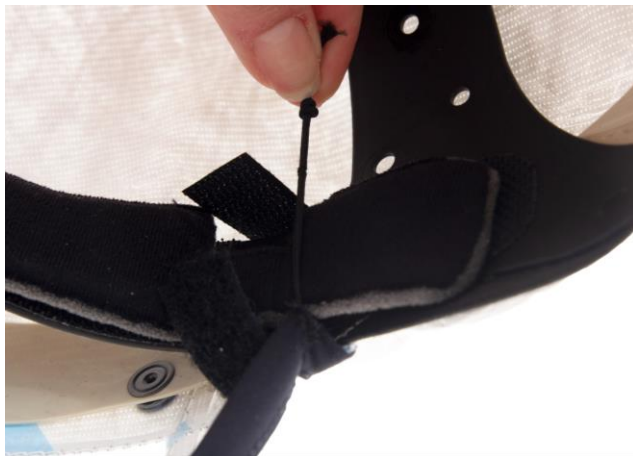
5.2 Lossa ansiktstätningens resårer som sitter fästade i pannbandet intill kardborrebanden.