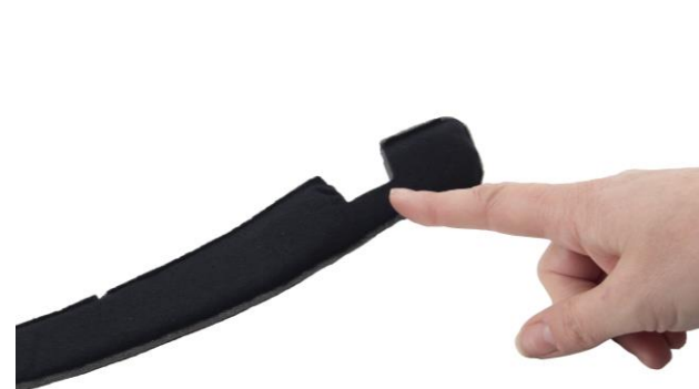
4.4 Montera kardborrebandet med den ruggade sidan mot pannbandet och urtaget uppåt.