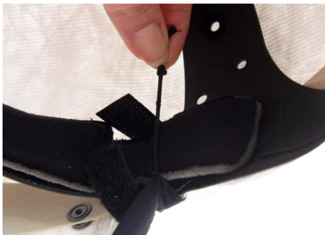
4.2 Lossa ansiktstätningens resårer som sitter fästade i pannbandet intill kardborrebanden.