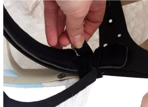
5.3 Lossa kardborrebanden.