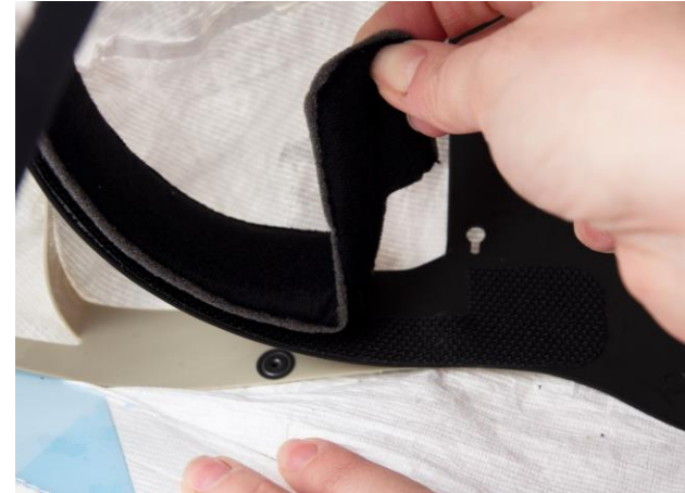
4.3 Svettbandet är fästat vid pannbandet med kardborreband. Dra loss svettbandet.